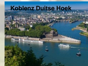
Koblenz Duitse Hoek